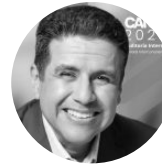
Benito Ybarra Estados Unidos 🇺🇸 Presidente de la Junta Directiva Global del Instituto de Auditores Internos (IIA)